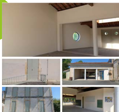
École primaire de Peymilou